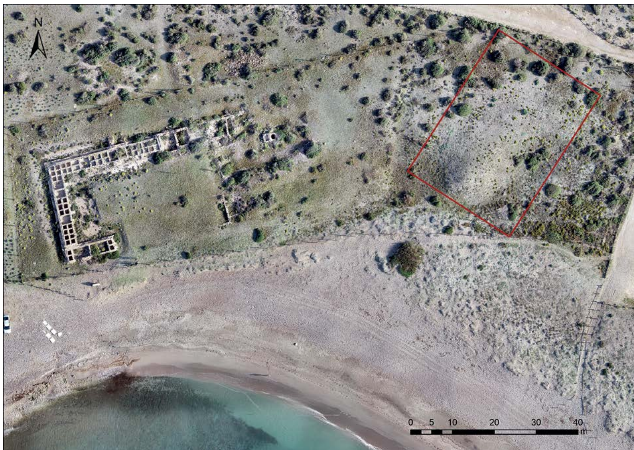
Figura 10.1. Localización del conchero estudiado en el yacimiento de Torregarcía.